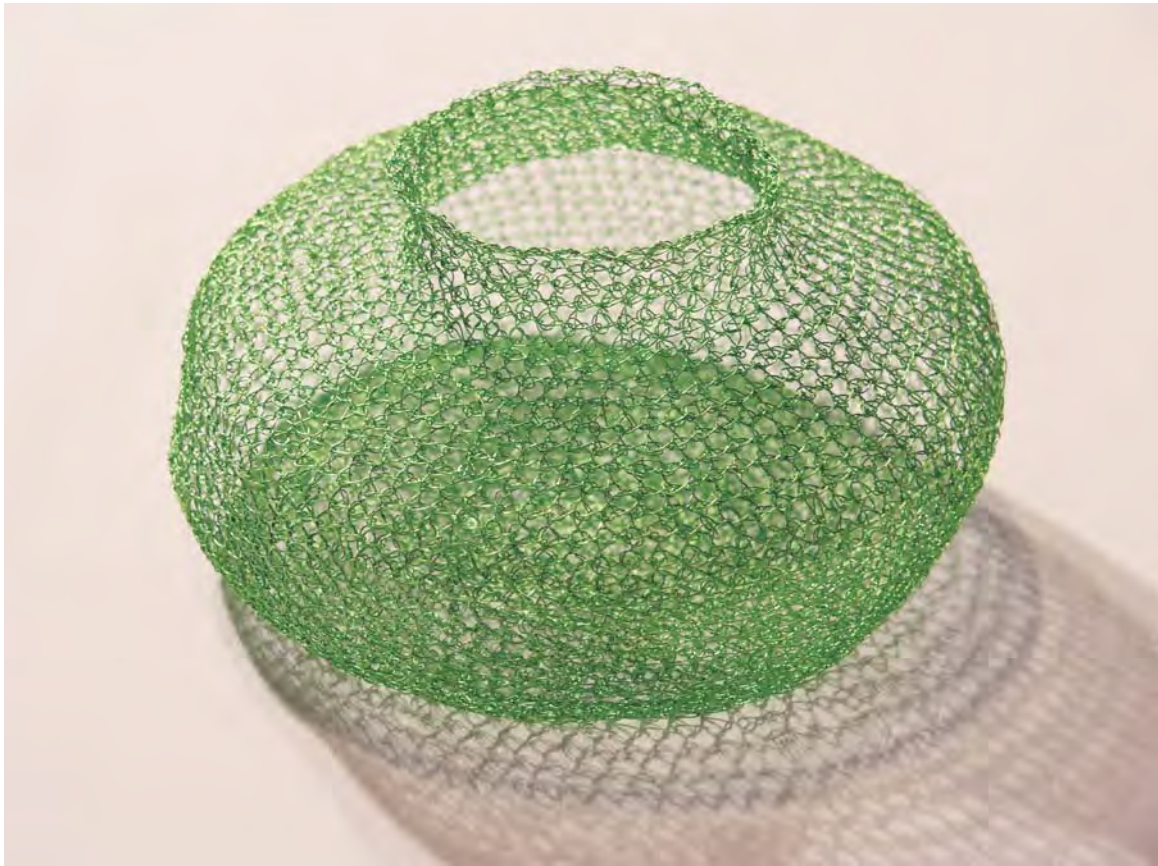
ANNA TALENS "Tejido (Cesta verde)" cobre lacado 9x15x15 cm.

Cada uno de nosotros comprendemos el mundo desde nuestro propio punto de vista. Pero a pesar de nuestras peculiaridades y diferencias, siempre hay emociones o situaciones que nos ponen en común. La experiencia de la vida conlleva momentos difíciles y otros de gloria. Así, entre este ir y venir, van transcurriendo nuestros días, escribiéndose nuestra propia historia. Lo delicado y hermoso, en nuestra sociedad, muchas veces es tachado de ingenuo y poco realista. Parece que los discursos que revuelven las entrañas son más efectivos que los que susurran. El arte incluso ha evitado hoy en día lo bello, por considerarlo vacío y superficial. Pero, a pesar de todo, en la poética del objeto, en el poder expresivo de los materiales, en lo delicado y en el objeto único manufacturado existen razones para pensar que en la belleza reside todavía una gran fuente de felicidad, siendo tan realista y necesaria como su opuesto.