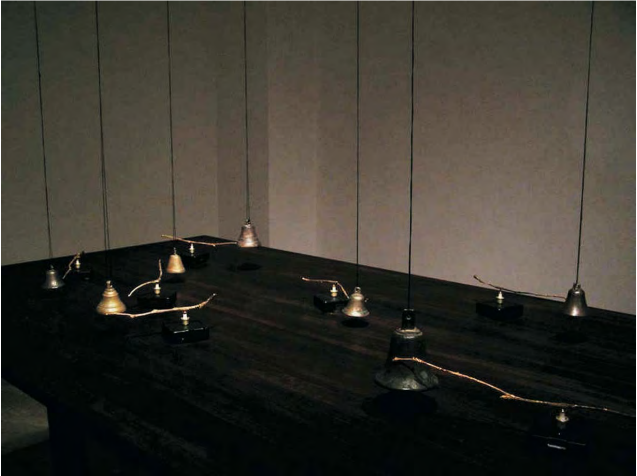
MAR ARZA "Libro de ahoras... [polifonías]" instalación medidas variables