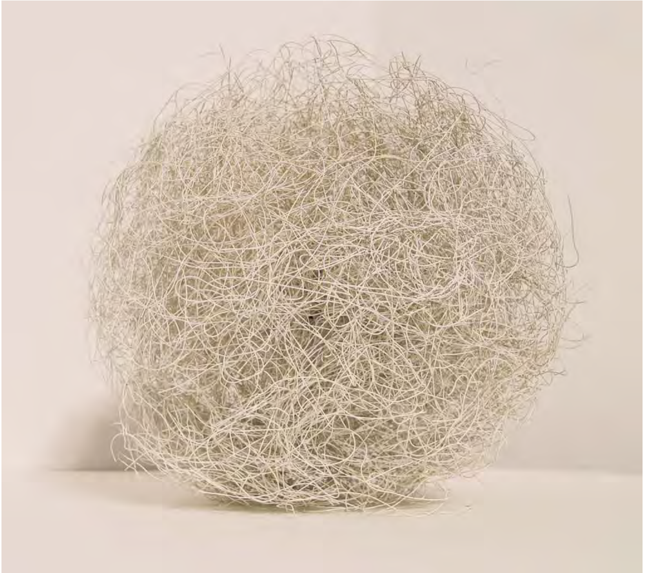
ANNA TALENS "Esfera blanca" hilo de latón y cascabeles 24x24x24 cm.