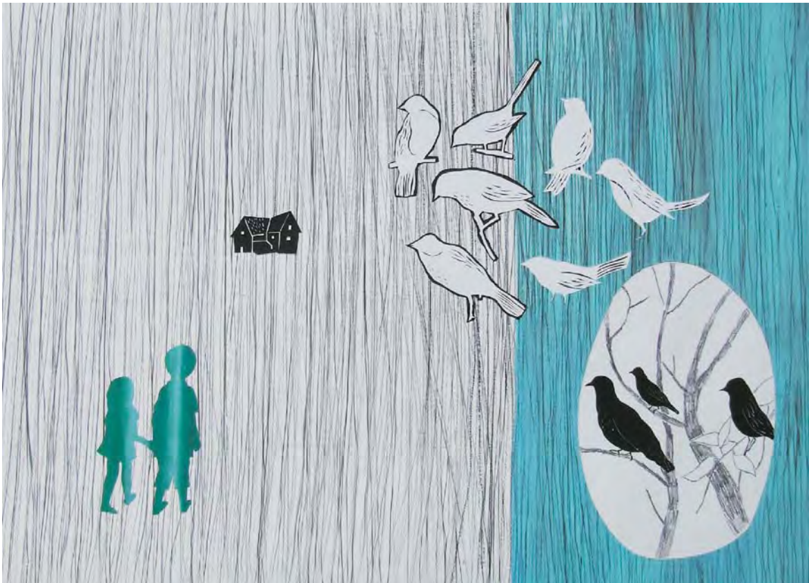
MARTA ESPINACH "Els nens perduts" dibujo y collage sobre papel 50x70 cm.

La serie de dibujos “De boscos i feres” (“De bosques y fieras”) toma como punto de partida algunos personajes y situaciones de cuentos infantiles que advierten a los niños del peligro de alejarse del núcleo familiar. Ya sea voluntaria o involuntariamente, al alejarse del hogar, los niños se encuentran con todo tipo de animales feroces, lobos, jabalís, osos...que ponen en cuestión el universo que conoce el niño, que le tientan a ir más allá, a tener iniciativa. Estas situaciones generalmente están ambientadas en bosques espesos y peligrosos, metáfora de un mundo exterior inhóspito que tiene el doble significado de ser un mundo nuevo por descubrir y que, por lo tanto, puede fascinar a nuestros personajes. Se hace por consiguiente, una reflexión en la que se juega con el punto de vista contradictorio de esa fascinación que supone adentrarse en un bosque lleno de peligros, donde podemos acabar en el estómago del lobo.