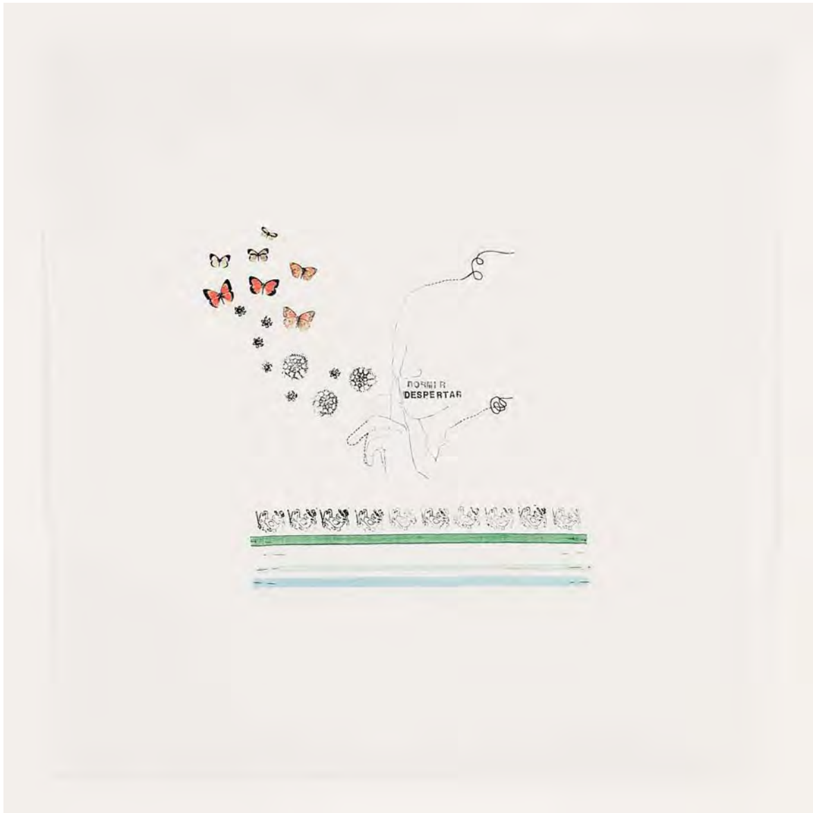
MARTA ESPINACH "Kisoko" (detalle) dibujo sobre sábana 115x112 cm.