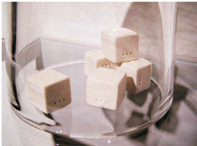
MAR ARZA "Índex" (detalle) porcelana, campana cristal, madera y vidrio 33x28x21 cm.