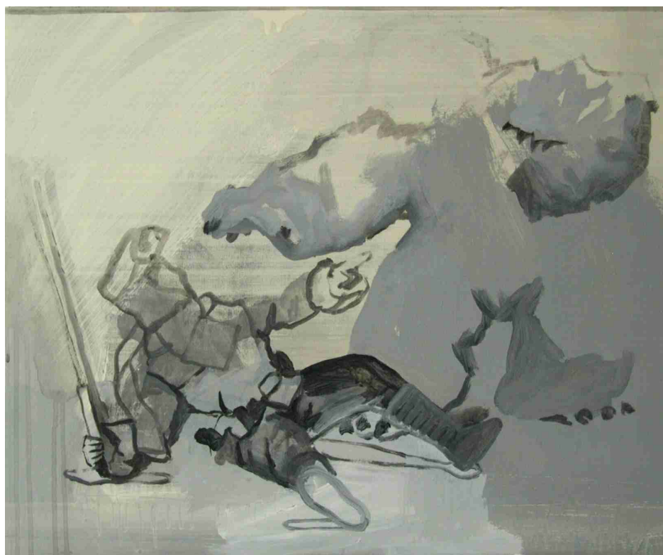
"E.S.B. Action Collection" , 2005 Acrílico sobre tabla, 50 x 60 cm.