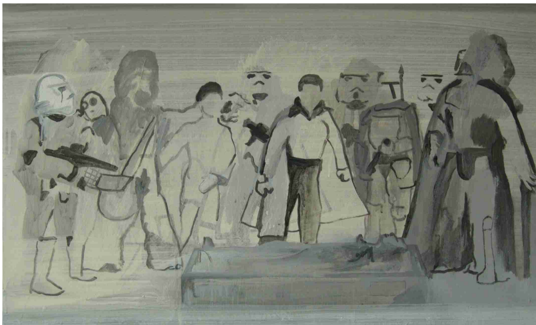
"E.S.B. Action Collection", 2005 Acrílico sobre tabla, 60 x 100 cm.