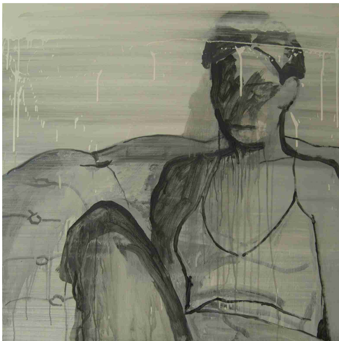
"Begoña", 2005 Acrílico sobre tabla, 100 x 100 cm.