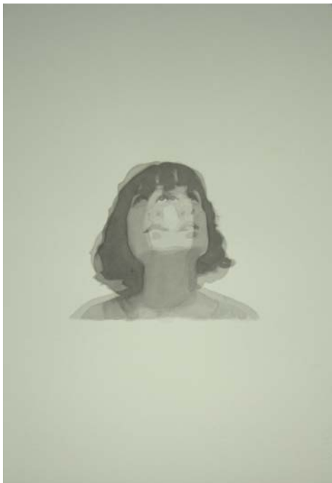
"S/T", 2009 tinta china sobre papel SuperAlfa 70x50 cm. c/u