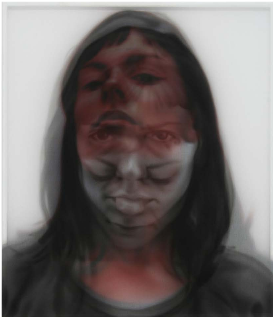
"S/T", 2009 acrílico sobre tabla y gasa 35x30 cm.

Del 18 de diciembre de 2009 al 5 de febrero de 2010