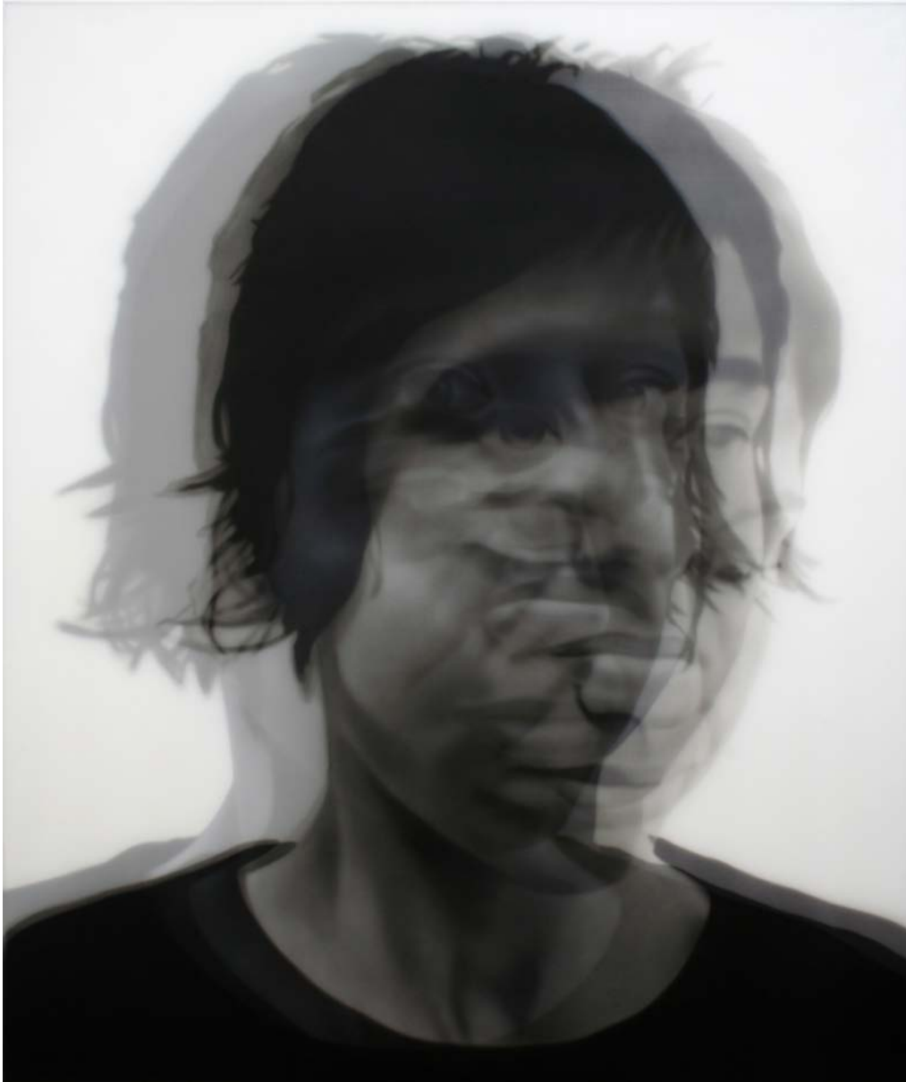
"Lo difuso", 2009 acrílico sobre lienzo y gasa 195x162 cm.

Del 18 de diciembre de 2009 al 5 de febrero de 2010