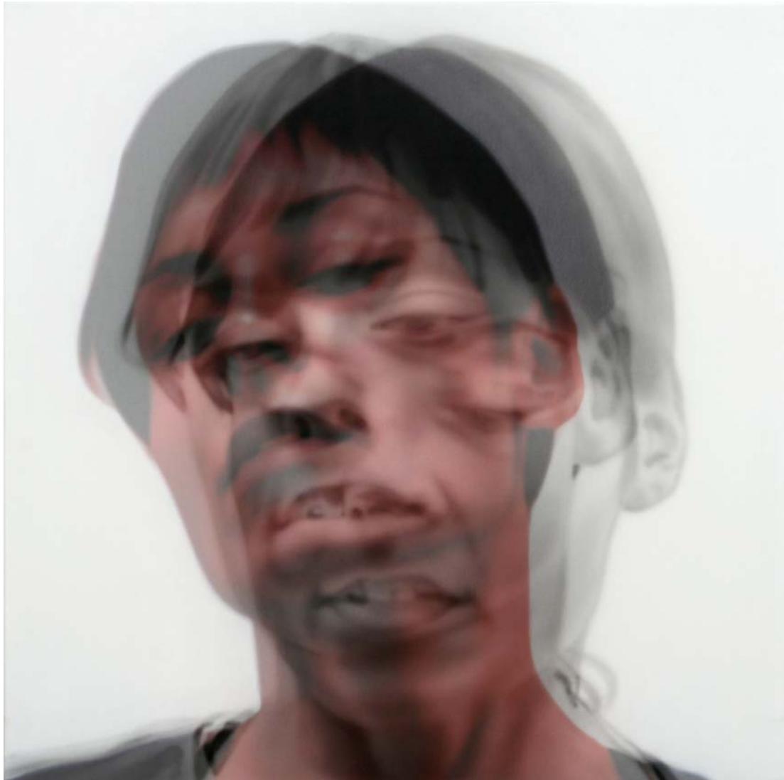
"Hipnosis", 2009 Acrílico sobre lienzo y gasa. 55x55 cm

Del 18 de diciembre de 2009 al 5 de febrero de 2010