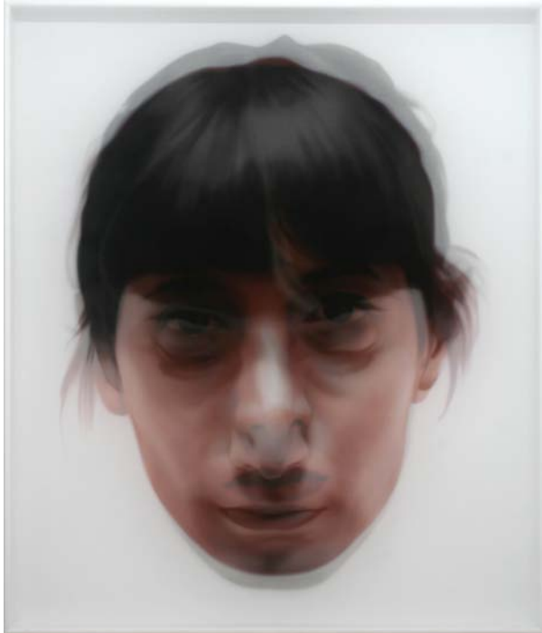
"En un abrir y cerrar de ojos II", 2009 acrílico sobre gasa y tabla 140x120 cm.

Del 18 de diciembre de 2009 al 5 de febrero de 2010