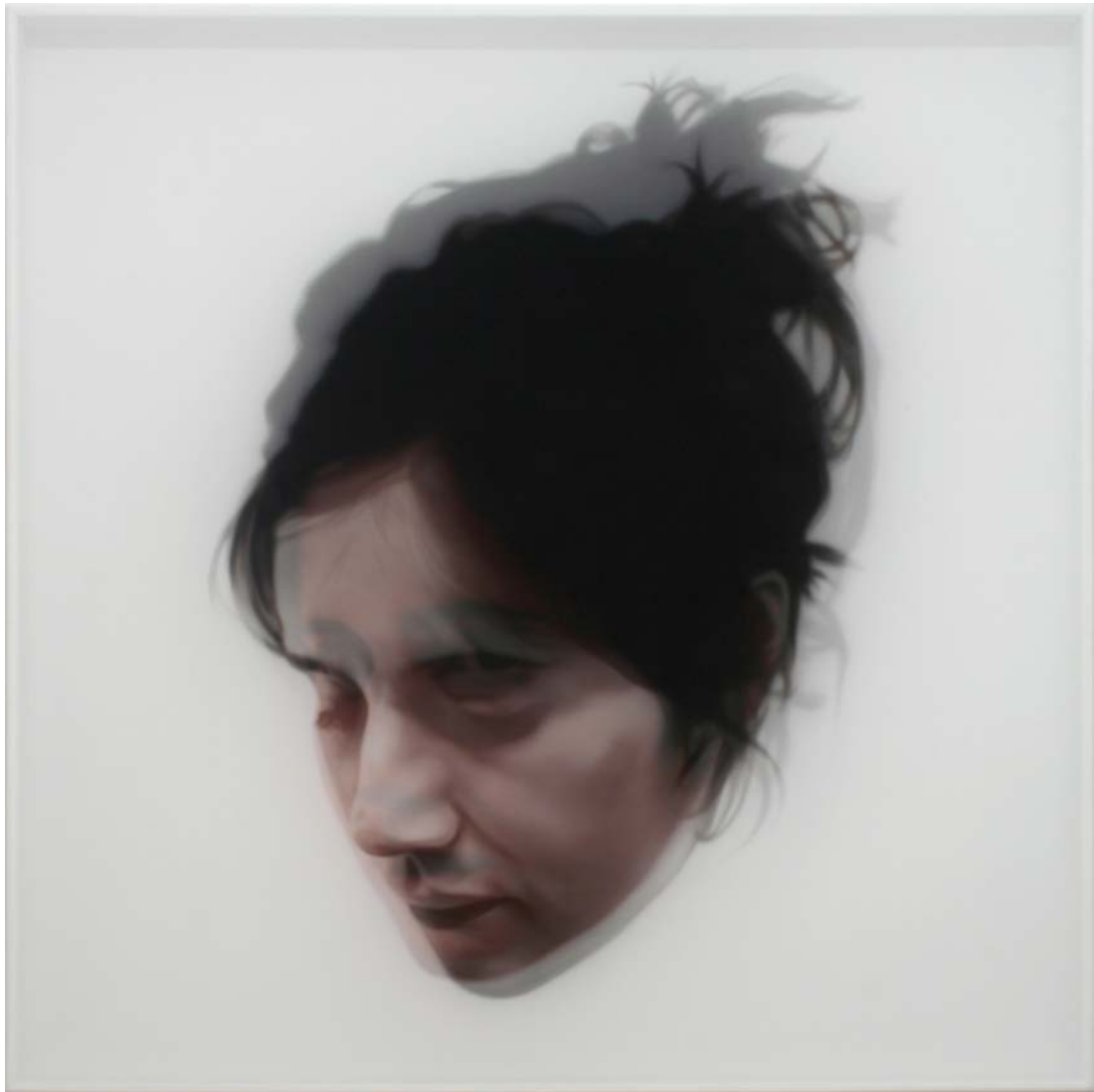
"Corpórea II", 2009 acrílico sobre tabla y gasa 120x120 cm.

Del 18 de diciembre de 2009 al 5 de febrero de 2010