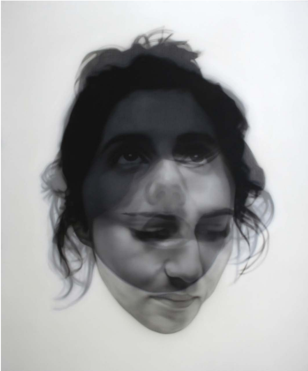
"Corpórea", 2009 acrílico sobre lienzo y gasa 195x162 cm.

Del 18 de diciembre de 2009 al 5 de febrero de 2010