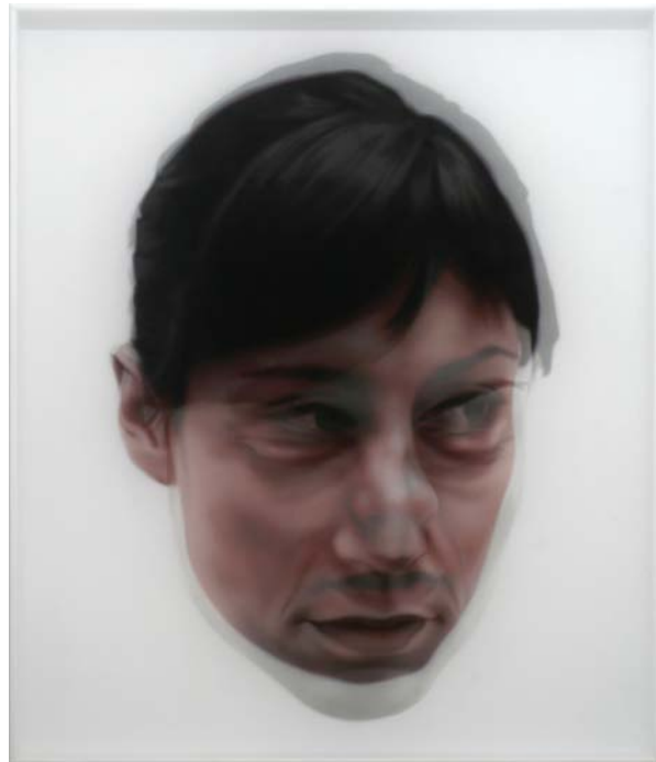
"En un abrir y cerrar de ojos", 2009 acrílico sobre gasa y tabla 140x120 cm.