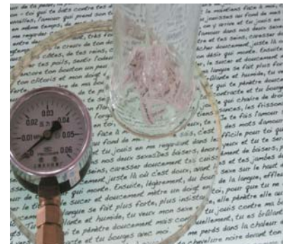
La casserole identitaire , 2007 Instalación vídeo-interactiva Aluminio, acero y ordenador. 190 x 161 x 82cm.