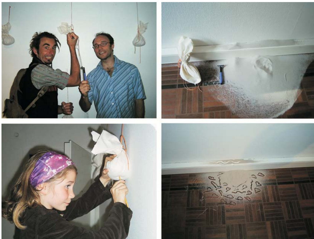
"Les sacs d'allégement" ( Los sacos de lastre), 2007 Arena, tela y cordel. Diferentes dimensiones.

Thomas Israël propone a través de sus obras lugares de reflexión, paréntesis a un mundo donde las sensaciones y las emociones están permitidas: es más, se ven multiplicadas; un lugar donde las asociaciones libres permiten al inconsciente abrirse camino allí donde la lógica racional no llega. En sus esculturas vídeo interactivas, Thomas Israël coloca al visitante en el interior de la obra. La presencia y la participación del espectador dan como resultado una discreta interactividad, siendo la obra la que escapa del artista para convertirse en parte del espectador mientras éste se encuentra, a su vez, en el espacio creado por el artista.