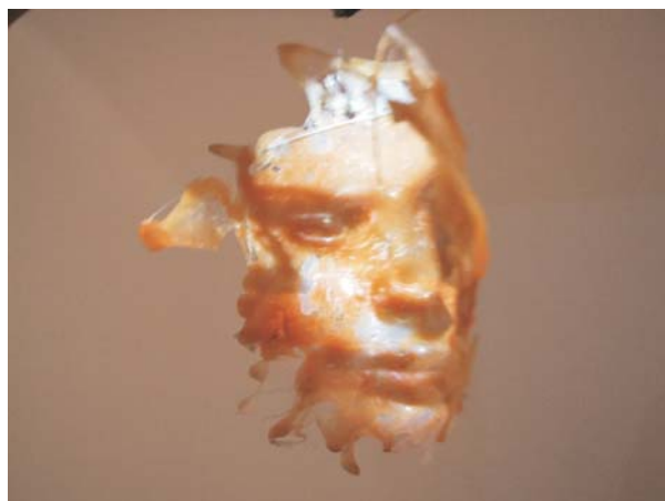
Le mobile Detalle , 2007 Acero, videoprojector, DVD y dinya 180 x 100 x 27cm