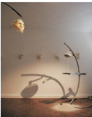
Le mobile et le sablier Le Sablier , 2007 Vídeo-escultura acero, vidrio, arena, pantalla y cámara. 193 x 161 x 82cm.

En la vídeo-escultura “ Le mobile ”, (el móvil), Thomas Israël diseña el mecanismo de la representación de sí mismo. Aparentemente, uno está frente a una imagen de identidad simple, ligera y flexible: una máscara-móvil sobre la que se proyecta una imagen también dinámica. Sin embargo, en el espacio que separa el cuerpo físico de la representación simbólica del cuerpo, entre la piel de la máscara y la imagen que se proyecta allí, hay un mundo entero. A esto hay que añadir la fragilidad de la imagen que contrasta con la imponente maquinaria que se utiliza para constituirla.