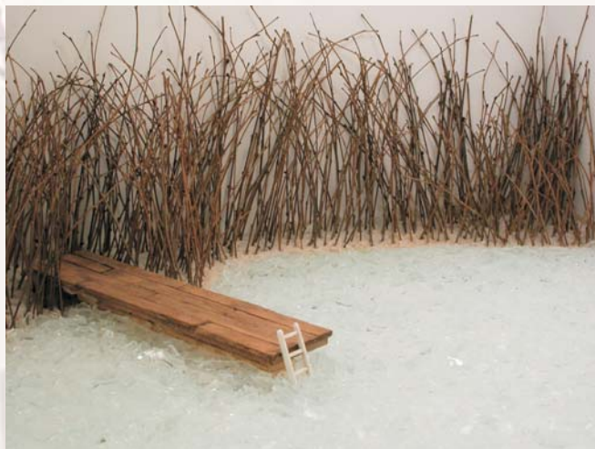
Entornos del silencio, 2005 Madera, cristal, plástico y luz 40 x 100 x 50cm