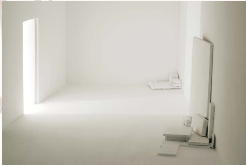
Sombras de ausencia, 2008 Madera y luz 50 x 124 x 62cm