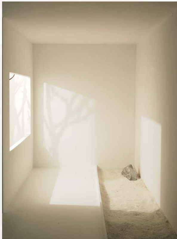
Contornos de Luz, Detalle 3, 2007. Madera, piedra, marmolina y luz. 44 x 102 x 62cm.