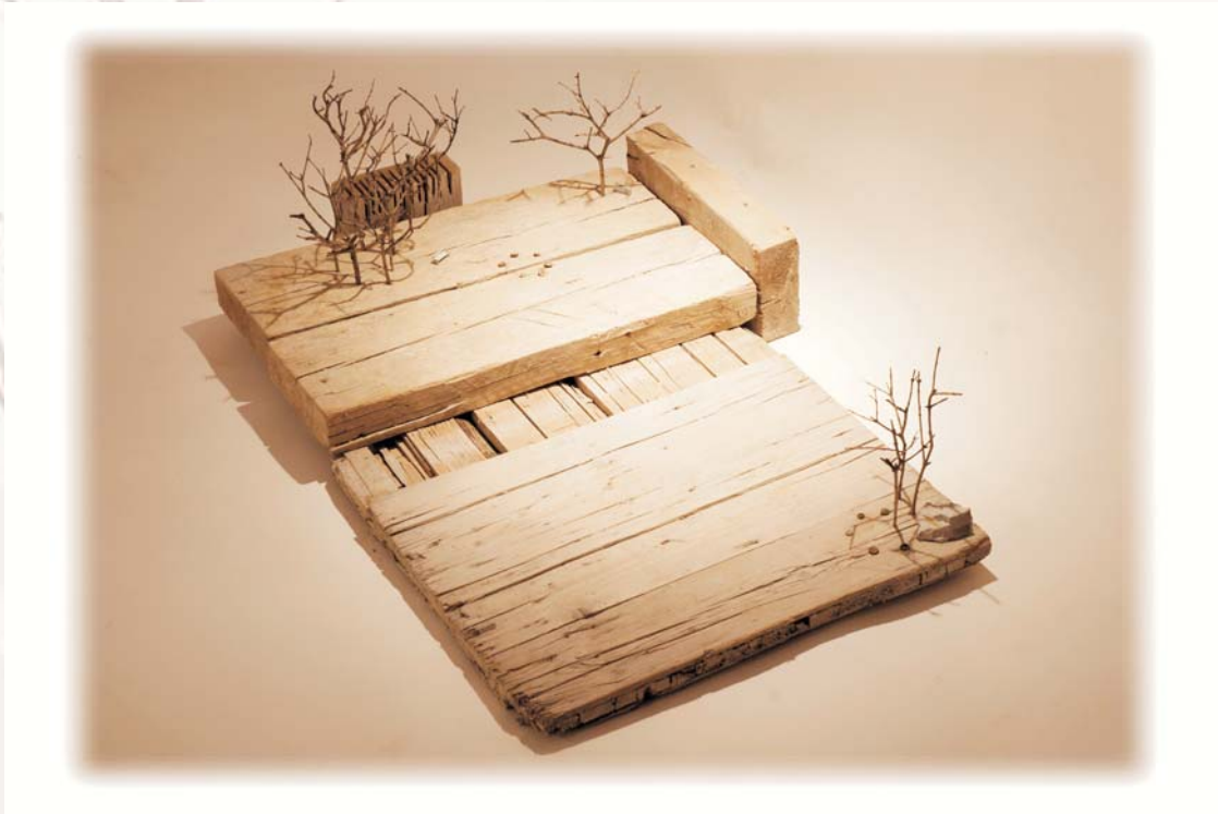
Espacio del misterio, 2007 Madera, plomo, piedra y luz 36 x 62 x 49cm

Galería pazYcomedias Comedias, 7 - 2ª pl · 46003 Valencia Tel. 96 391 89 06 · www.pazycomedias.com