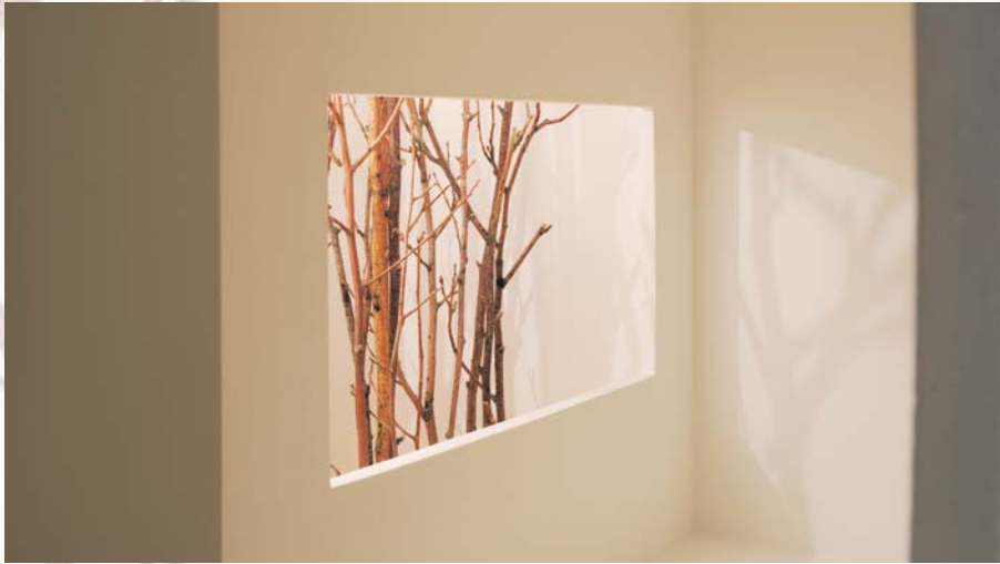
Contornos de Luz, Detalle 6, 2007. Madera, piedra, marmolina y luz. 44 x 102 x 62cm.