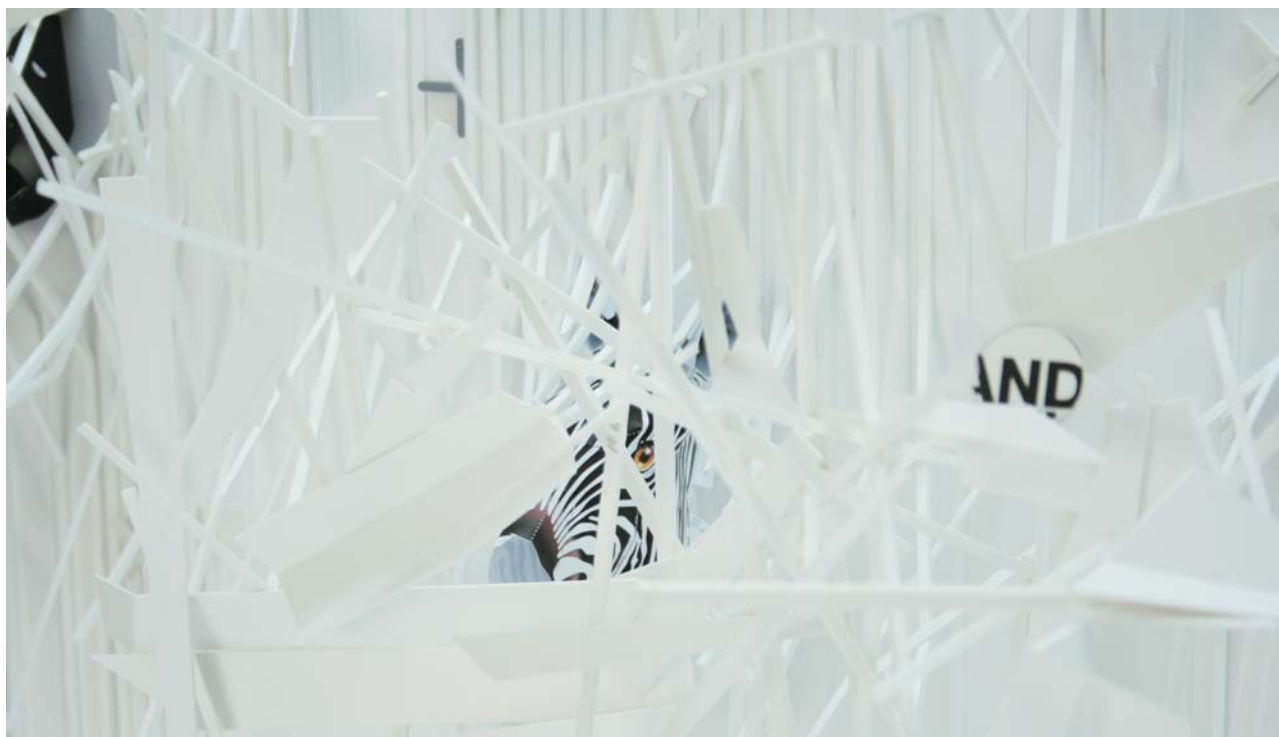
"Parachute" (detalle), 2010 instalación medidas variables

Del 24 de septiembre al 5 de noviembre de 2010