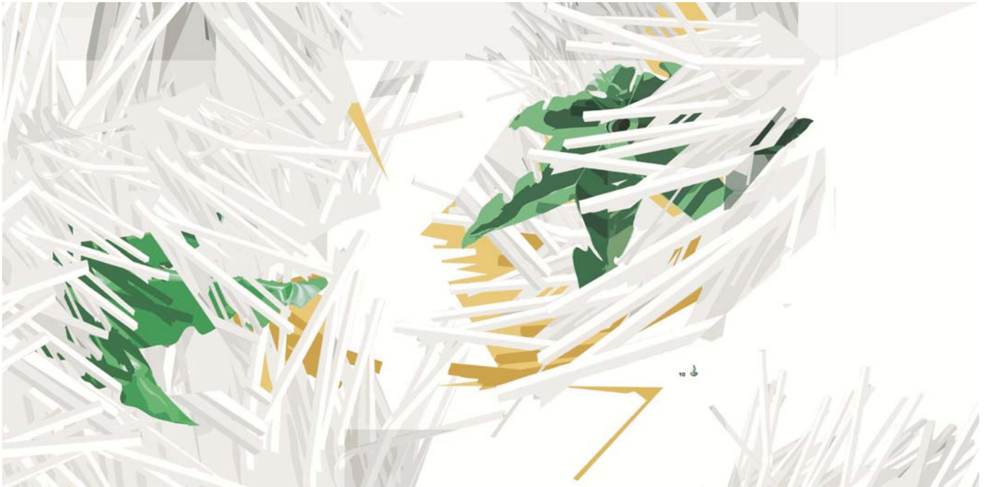
"Parachute" , 2010 mixta sobre metacrilato 118x238 cm.

Del 24 de septiembre al 5 de noviembre de 2010