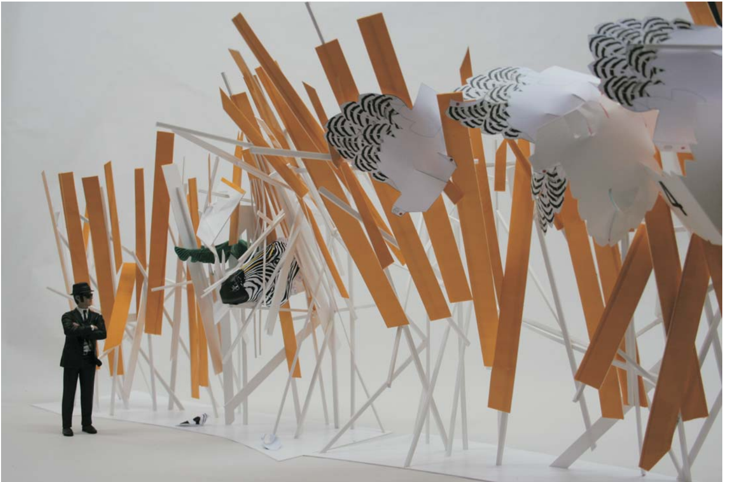
"Parachute" (detalle), 2010 instalación medidas variables

Del 24 de septiembre al 5 de noviembre de 2010