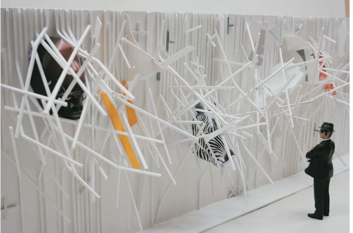
Parachute, 2010 instalación medidas variables

Del 24 de septiembre al 5 de noviembre de 2010