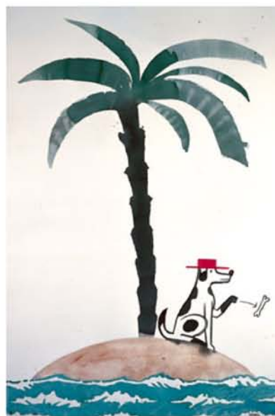
Aïllat 6, 2004 Acuarela sobre papel 150 x 100cms

Los distintos personajes que pueblan las obras de la serie son distintos avatares, distintos aspectos del autor, quizá exceptuando a uno, el Michelin, aunque tal vez no.