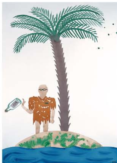
Aïllat 4, 2004 Acuarela sobre papel 150 x 100cms