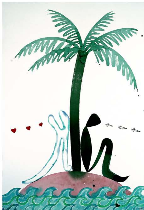
Aïllat 10, 2004 Acuarela sobre papel 150 x 100cms