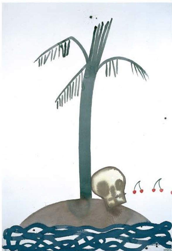
Aïllat 9, 2004 Acuarela sobre papel 150 x 100cms