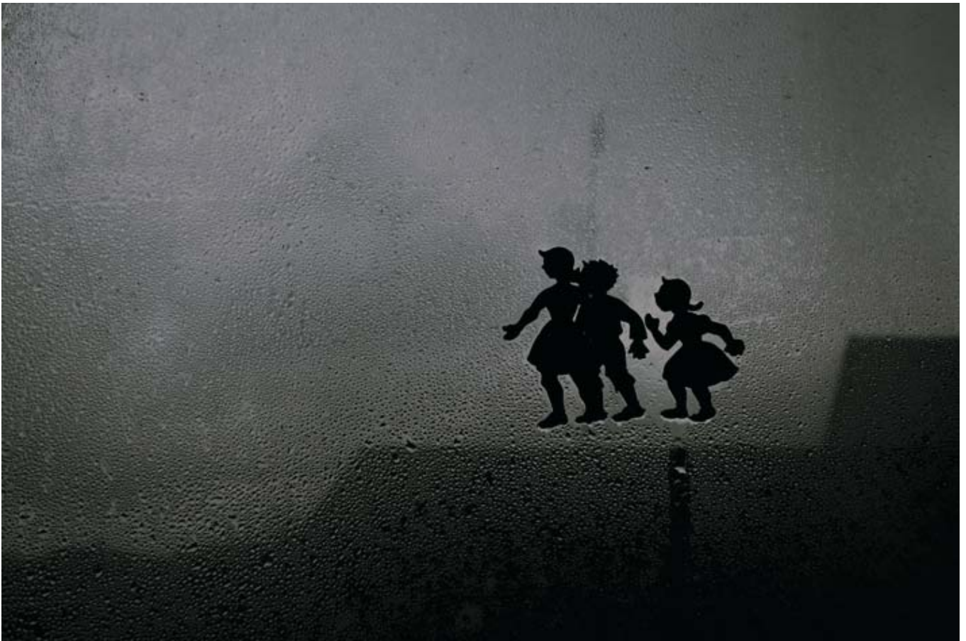
"Nunca volverás a casa", 2010 Inkjet, pigmentos naturales papel RC sobre forex 40x60 cm. Ed. 3 ejemplares

del 17 de septiembre al 22 de octubre de 2011