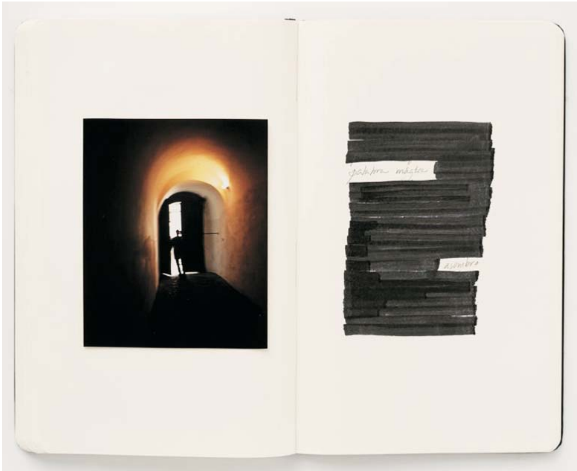
"Treinta y seis años sin tristeza 31", 2009 Fotografía color Inkjet, papel RC 100x128 cm. Ed. 3 ejemplares

del 17 de septiembre al 22 de octubre de 2011