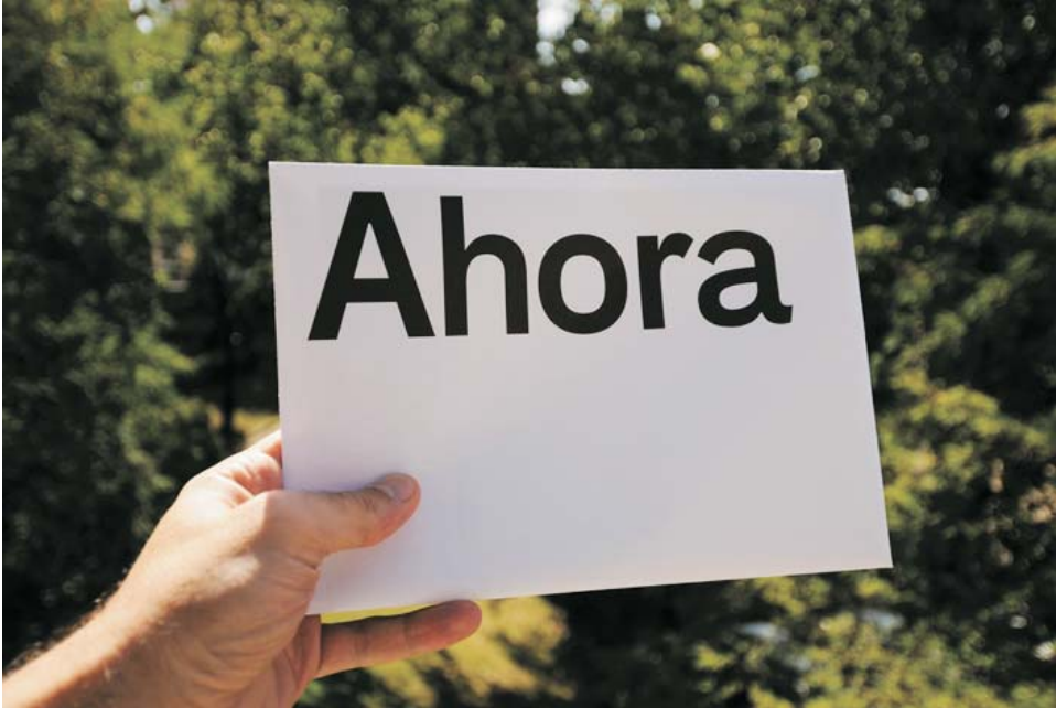
"Nunca volverás a casa", 2010 Inkjet, pigmentos naturales papel RC sobre forex 40x60 cm. Ed. 3 ejemplares

del 17 de septiembre al 22 de octubre de 2011