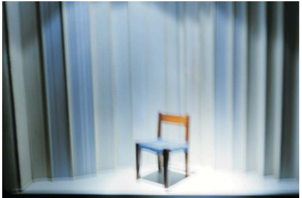
"Nunca volverás a casa", 2010 Inkjet, pigmentos naturales papel RC sobre forex 40x60 cm. Ed. 3 ejemplares