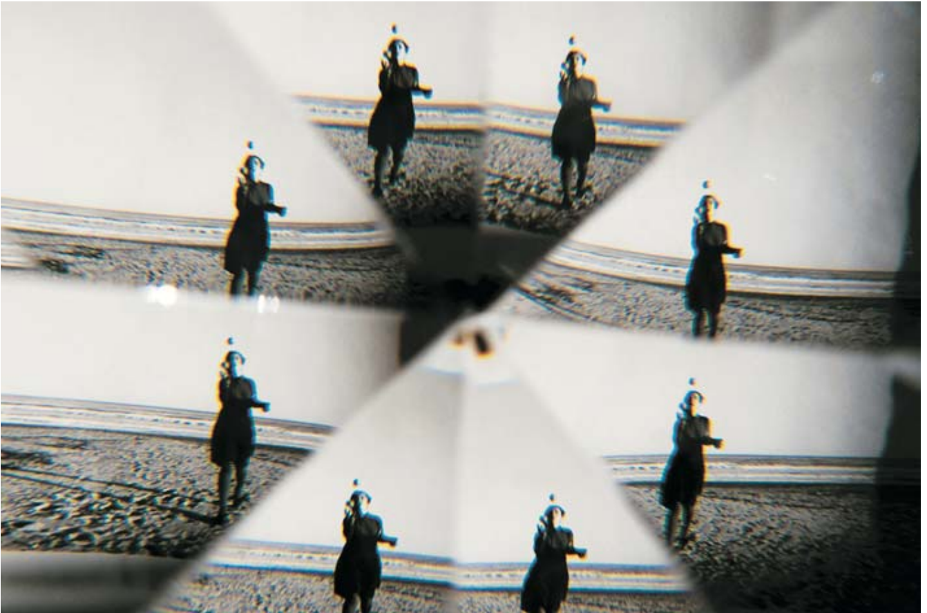
"Nunca volverás a casa", 2010 Inkjet, pigmentos naturales papel RC sobre forex 40x60 cm. Ed. 3 ejemplares

del 17 de septiembre al 22 de octubre de 2011